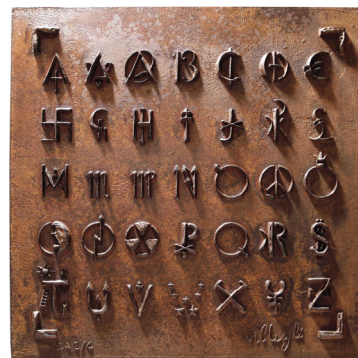
Alphabet, 2010 • plaque de fonte patinée à la cire de bitume • 79,58 x 79,5 cm • courtesy : galerie G.P.&N. Vallois et J. Villeglé •

• Jacques Villeglé est représenté par la galerie Georges-Philippe & Nathalie Vallois.