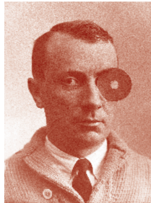
Arp avec Monocle-nombril, vers 1926 Arp mit Nabelmonokel, circa 1926 Stiftung Arp e.V., Berlin

Arp: Poetry of Forms s'inscrit dans l'année thématique internationale Mondrian to Dutch Design, 100 years of shaping the world en l'honneur du centenaire de la fondation du mouvement De Stijl. À travers un imposant programme, des musées et sites du patrimoine de l'ensemble des Pays-Bas rendent hommage à Van Doesburg et aux autres membres de la première heure, notamment Piet Mondrian, Bart van der Leek et Vilmos Huszár.