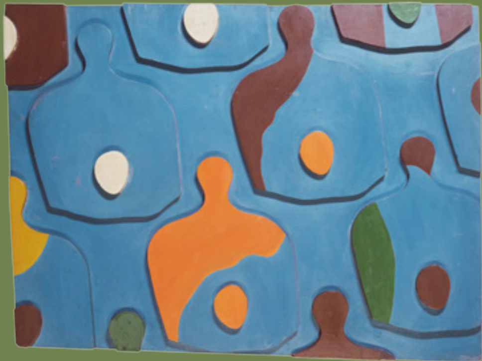
La planche à oeufs/Das Eierbrett, 1922, Collection privée/ Privatsammlung